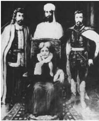
Madame Blavatsky with Masters Kuthumi, El Morya & St. Germain Origins (and credentials) of photograph unknown

pendiri Theosophical Society mengatakan bahwa St. Germain adalah salah satu dari Masternya dan bahwa St. Germain telah memberikan dokumen rahasia ilmu Misteri Kuno kepadanya.